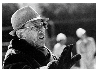
浜松市美術館発行 「中根金作とその庭の美」より