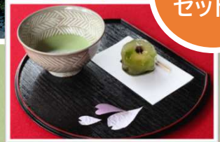
イメージ写真です